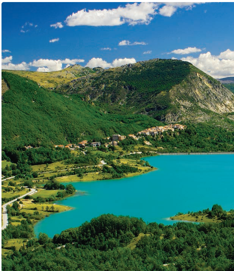
Veduta totale del bacino artificiale di Castel San Vincenzo